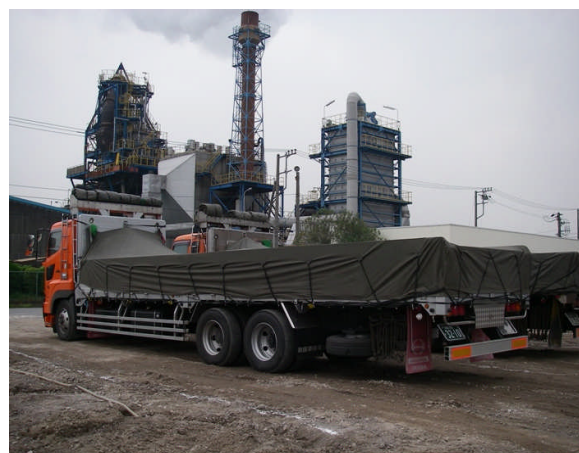
写真 1-4 汚染土壌養生後の搬出状況