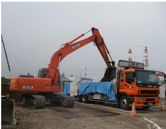
写真 1-3 汚染土壌の積込み状況