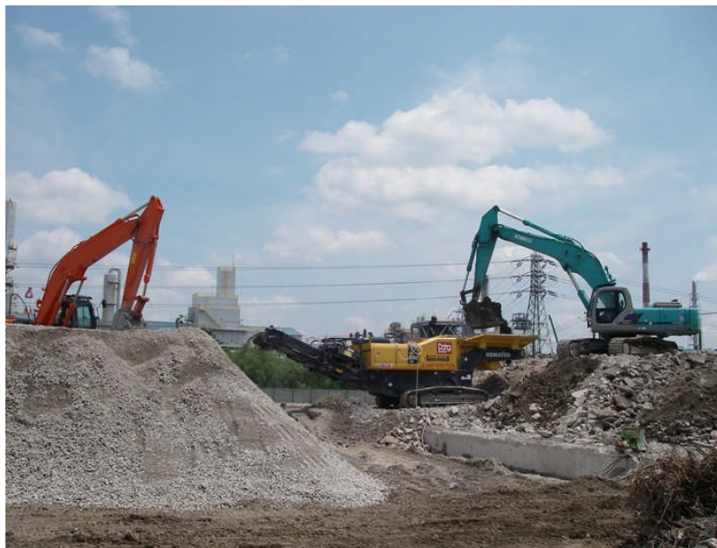
写真 3-1 コンクリート、ALC の再利用状況