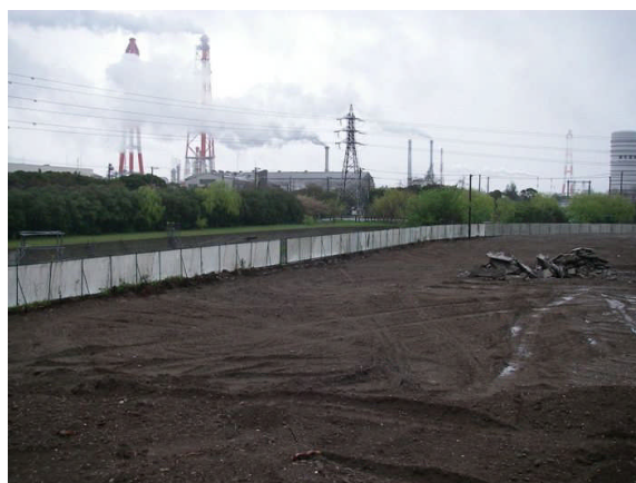
写真 2-4 防砂ネット：西側