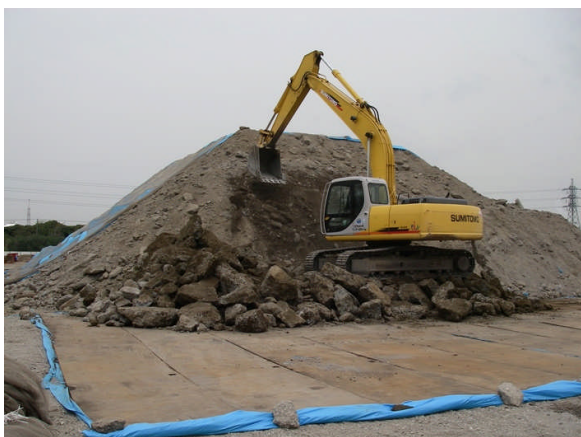
写真 1-1 汚染土壌仮置き場の状況