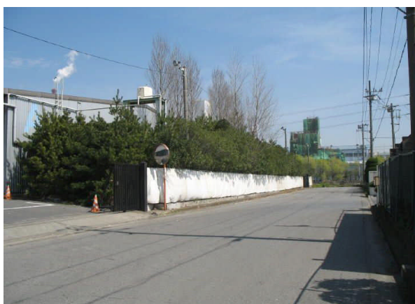
写真 2-3 防砂ネット：南側