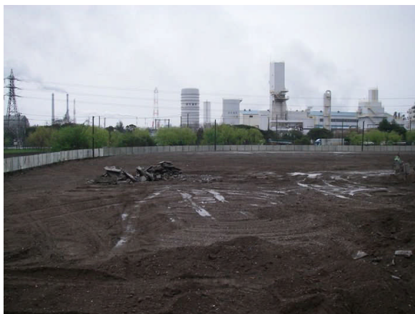
写真 2-1 防砂ネット：北側～西側