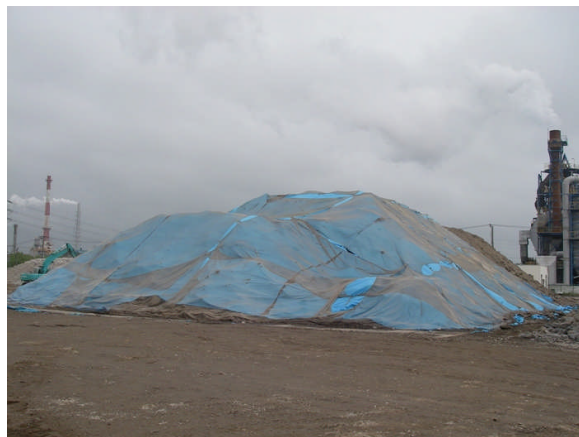
写真 1-2 汚染土壌養生の状況