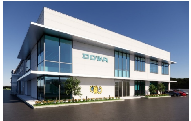
アクトビー分工場の完成予想図